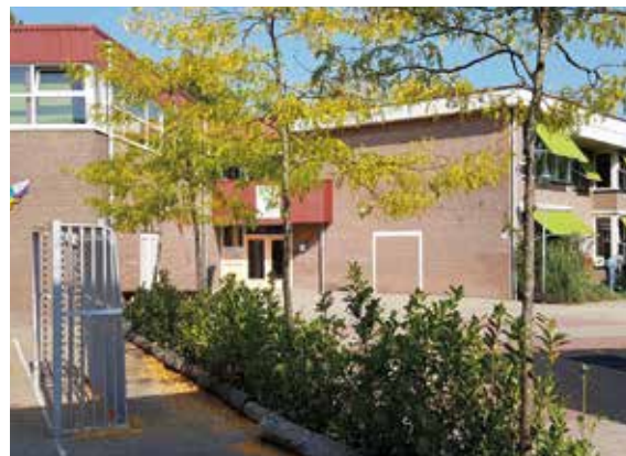
PI staat voor Paedologisch Instituut.